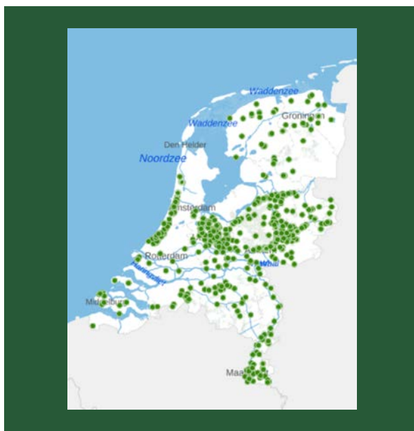
Kaart 1. Overzichtskartaal rijksbeschermd buitenplaatsen 11

kent zo'n 1400 groene rijksmonumenten die zijn opgenomen in het monumentenregister 10 .